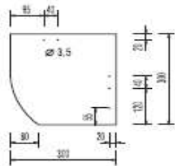
plytka lewa 30/30 cm, krycie prawe

Kształt płytek włóknocementowych i sposób układania