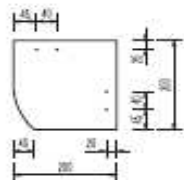
plytka lewa 20/20 cm, krycie prawe (tylko elewacje)