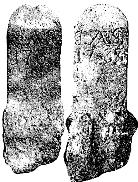
Ilustracja 2: Wygląd odnalezionych kamieni granicznych.

Jak widać na ilustracji 1, oba kamienie były przewrócone, zarośnięte mchem i przysypane igliwem. Prawdopodobnie od lat nikt nie wiedział o ich istnieniu, a są to zabytki dokumentujące historię tych ziem, ich fotografie przedstawia ilustracja 2. Widoczne tu inskrypcje „I.A.G. 1733” informują, że odnalezione znaki ustawiono w 1733 roku na granicy ziem należących do opata krzeszowskiego Innocentego, gdyż monogram „I.A.G.” należy rozwinąć jako „Innocentius Abbas Grissoviensis”.