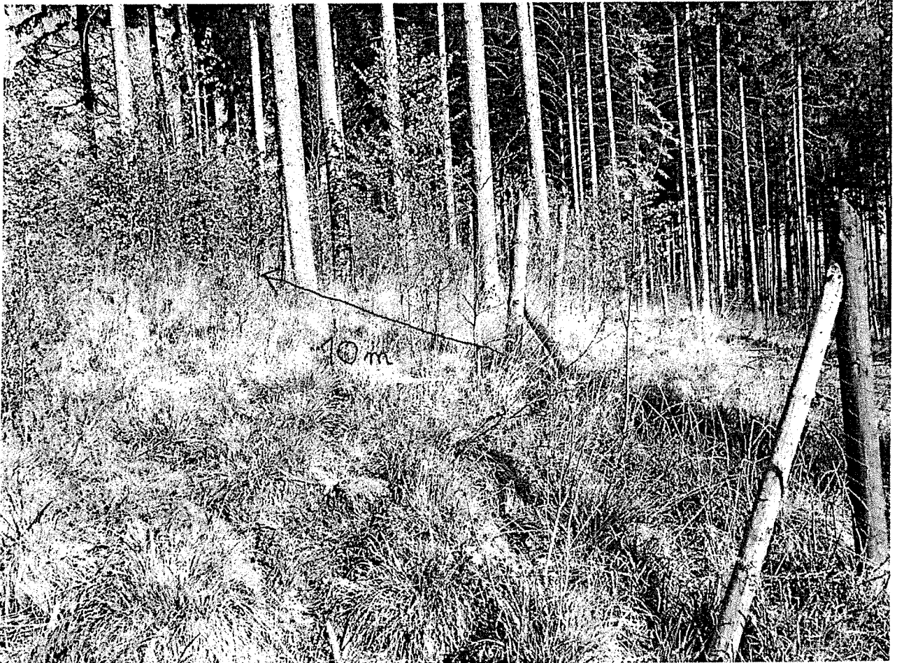
Ilustracja 4: Lokalizacja przewróconego kamienia: 10 metrów od widocznego tu zalamania ogrodzenia.