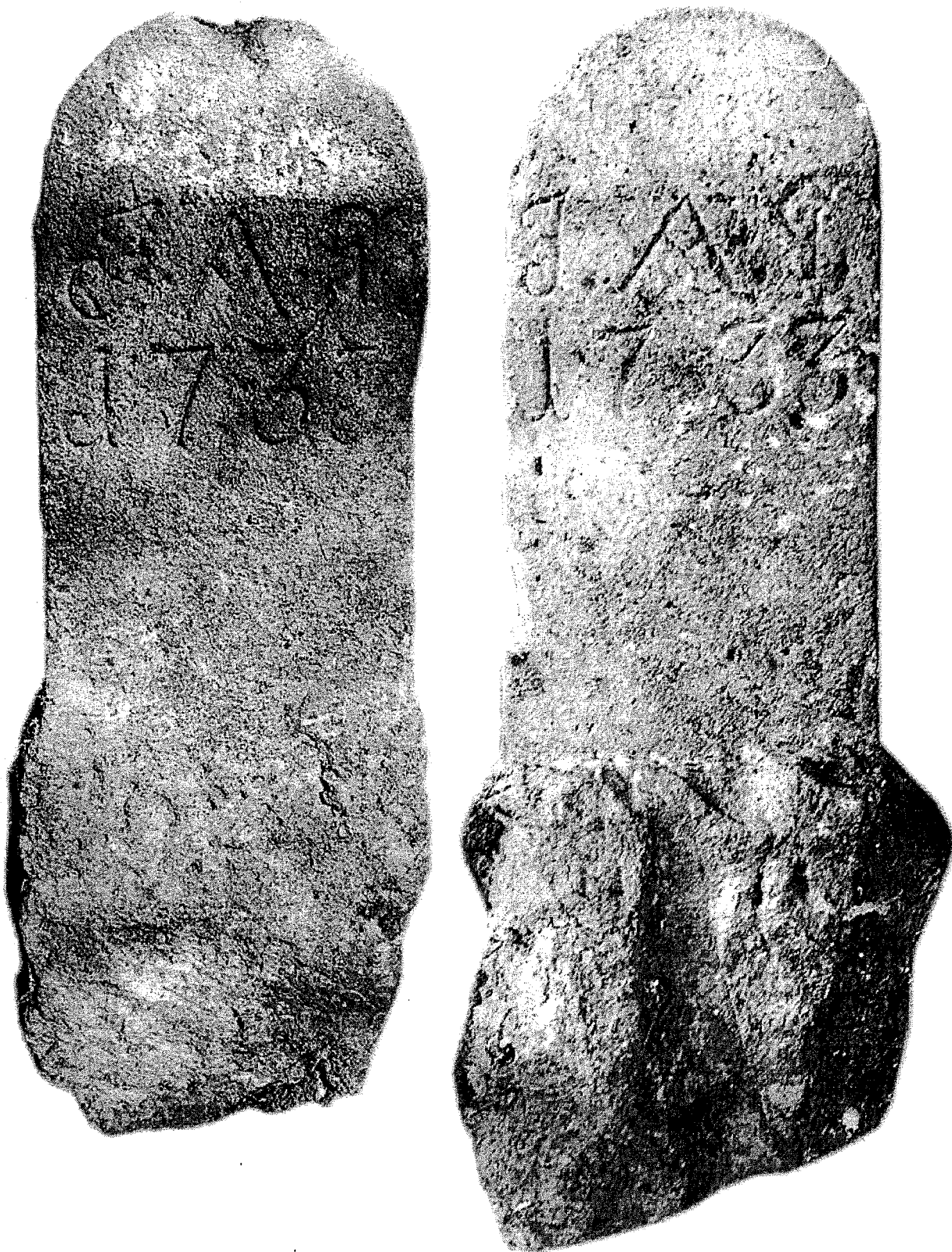
Ilustracja 2: Wygląd odnalezionych kamieni granicznych; po lewej kamień północny, po prawej kamień południowy.