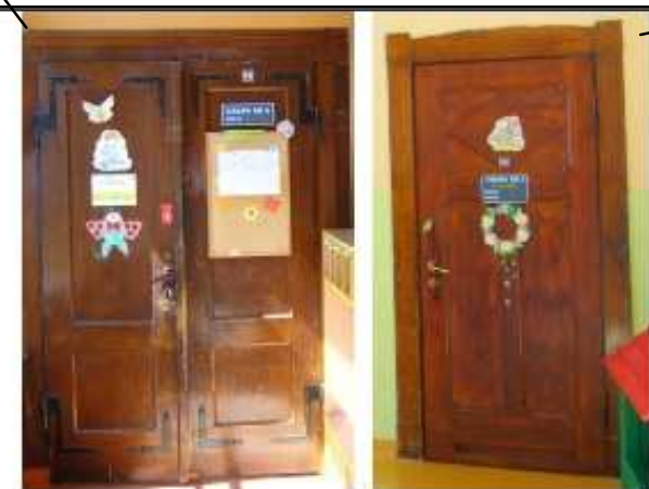
Zbiornik - drzwi do sali nr 16 i nr 18