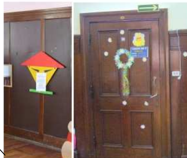
Zbiornik - boazeria w sali nr 16 i drzwi do sali nr 20

UWAGA: Numeracja pomieszczeń przedstawiona na kartach adresowych odnosi się do numeracji sal dydaktycznych Przedszkola (stan obecny)