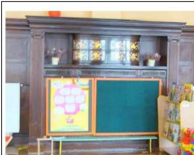
Zbiornik - obudowa kominka w sali nr 21